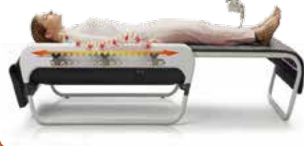
脊椎（背骨）を自動スキャンング