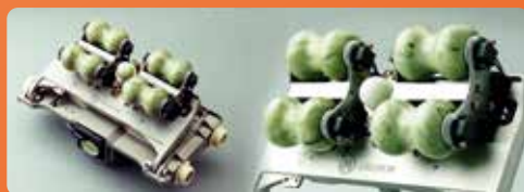
内部加温加圧ヒスイ球軸