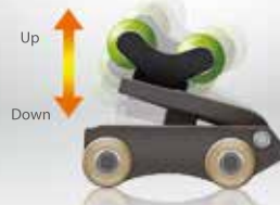
[ MOVING THE INTERNAL PROJECTOR ]

脊椎スキャニングで個人別に異なる脊椎の特性を分析し、内部加温加圧ヒスイ球軸が使用者の脊椎に合わせて自動で上下の高さを調節する 革新的な機能で、効果的なリラクゼーションを受けられます。