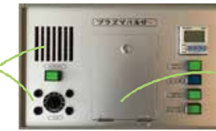
プラズマパルサー 本体