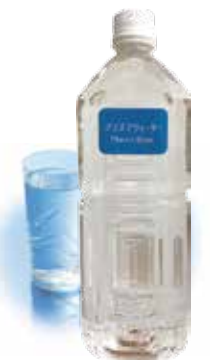
* イメージプラズマウォーター(別売)

飽和状態のマイナス電子とNO(一酸化窒素)を多く含んだプラズマウォーターをパルサーにセットします。このことによってORP(酸化還元電位)が調整されたやさしい専用水になり、これを活用することでより楽しみが増えます。